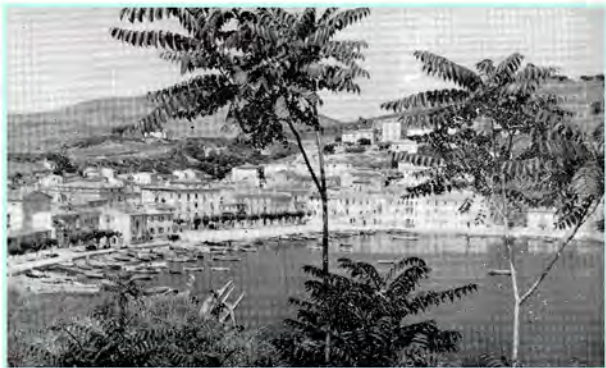
Porto Azzurro : un angolo della costa napoletana trasportato all' Elba, un romantico asilo di serenità.