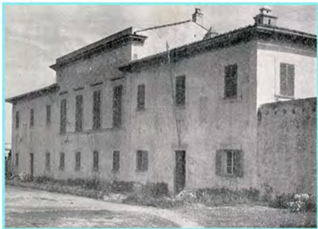
L'umile Casa dei Mulini, piccola e suggestiva dimora di un grande: Napoleone.