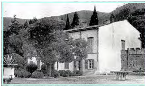
San Martino, la Sua casa di campagna, l'albero da lui piantato : si parla di Napoleone, e qui tutto parla di Lui.