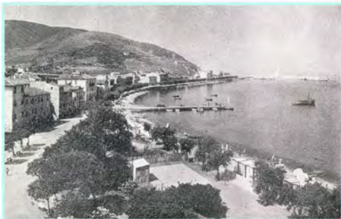
Marciana Marina — La bella dormiente adagiata sulla riva di un mare ove il canto delle sirene è più dolce e incantatore