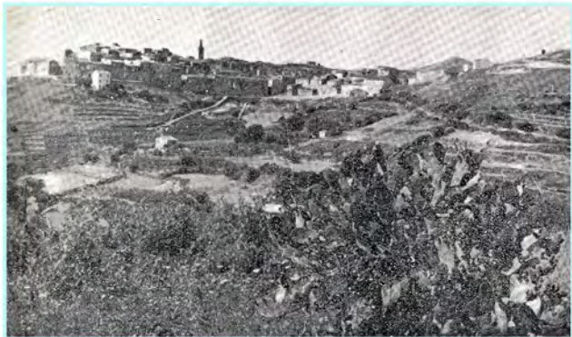
Capoliveri affacciata ad un magico balcone sul mare meridionale dell'Isola, domina il leggendario Capo di Calamita.