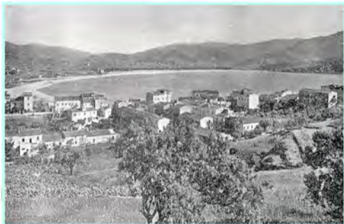
Marina di Campo — L'arco della spiaggia, sottolineato dal verde della pineta, si apre verso il sole come la corolla di un tulipano gigantesco.