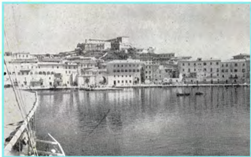
Portoferraio, il capoluogo dell'Elba, si specchia nella darsena tranquilla, calda di sole e di colore.