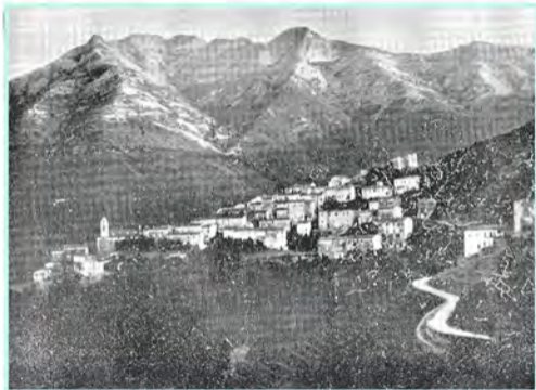
A Marciana il gregge delle case s'inerpica fra i castagni verso la più alta cima dell'Elba, il Monte Capanne.