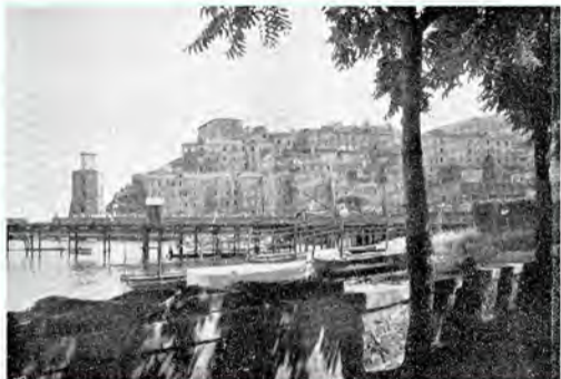
Rio Marina , sul mare rosseggiante di ruggine, risuona del lavoro delle miniere di ferro, ricchezza dell' Elba e dell' Italia